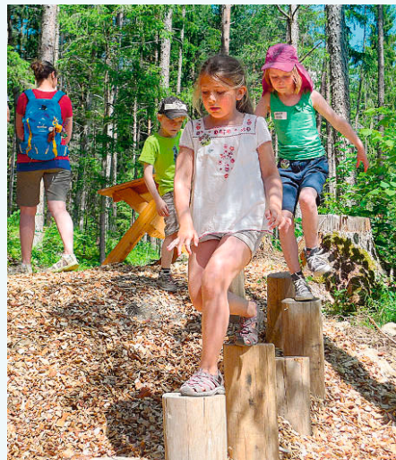
Eine Erlebnisstation des Zauberwalds